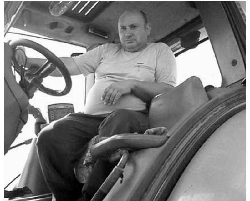
Окончание на 2-ой стр. О.Н. Борисов.